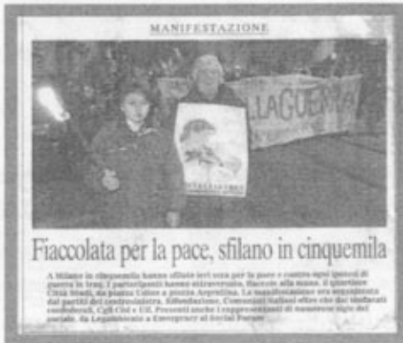
Fiaccolata per la pace, sfilano in cinquemila

A Milano la situazione è buona. L'ultima sera per la pace e contro ogni guerra di guerra in Iraq, i partecipanti hanno attraversato, mano alla mano, il quartiere Città Studi, da piazza Cello a piazza Arona. La manifestazione era organizzata dai partiti del centro-sinistra, dall'Arcidiocesi, i Comitati italiani oltre che dai sindacati confederali, Cgil, Cisl e Uil. Presenti anche i rappresentanti di numerose sigle del sociale, da Legambiente a Emmeperce al Social Forum.